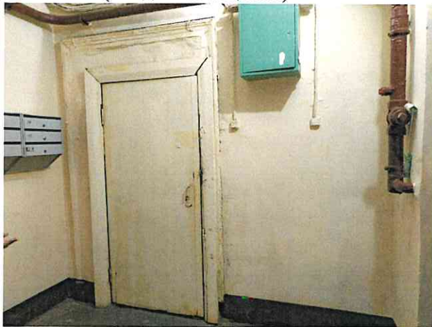
Фото № 3 (вход в помещение)