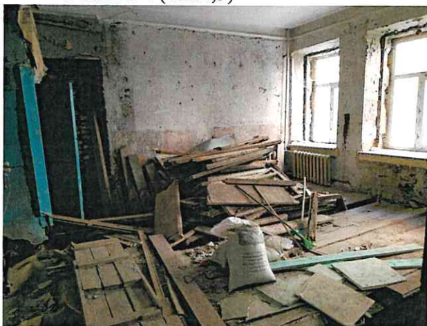
Фото № 4 (ч.п.2,3)