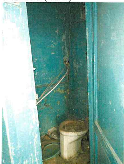
Фото № 5 (ч.п. 2)