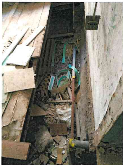
Фото № 7