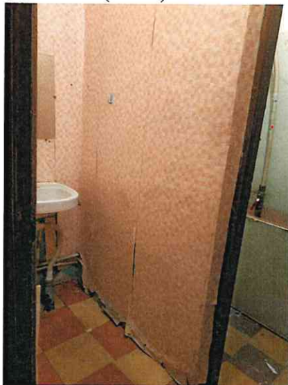
Фото № 7 (ч.п. 3)