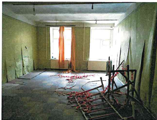
Фото № 10 (ч.п. 6)