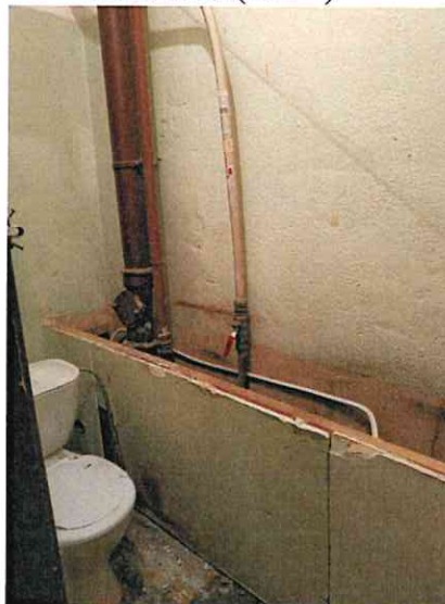
Фото № 8 (ч.п. 4)