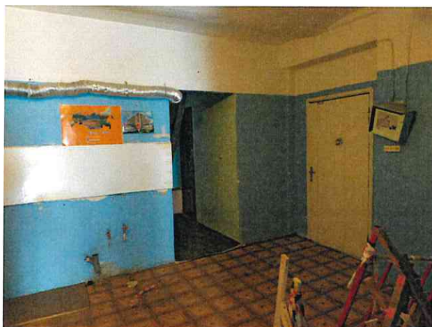
Фото № 5 (ч.п. 2)