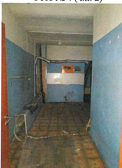
Фото № 4 (ч.п. 2)