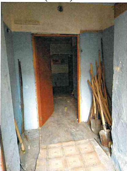
Фото № 3 (ч.п. 1)