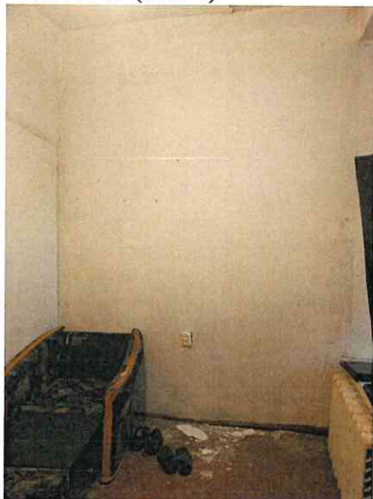
Фото № 7 (ч.п. 4)

Акт осмотра объекта нежилого фонда от 12.11.2020, расположенного по адресу: Санкт-Петербург, Галерная ул., д. 54, лит. А, пом. 3-Н