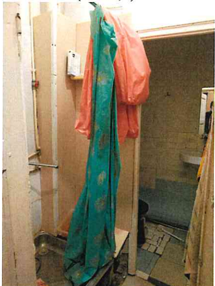
Фото № 5 (ч.п. 2,3)