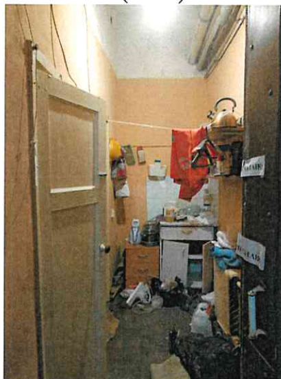
Фото № 4 (ч.п. 1)