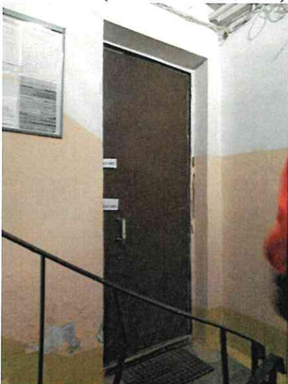
Фото № 3 (вход в помещение)