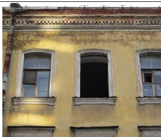
Фото 4. Вид здания, в котором расположен объект оценки