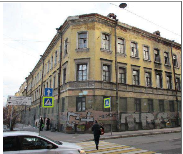
Фото 10. Вид здания, в котором расположен объект оценки