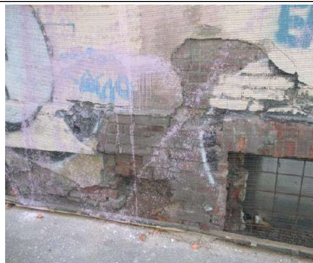
Фото 7. Вид здания, в котором расположен объект оценки