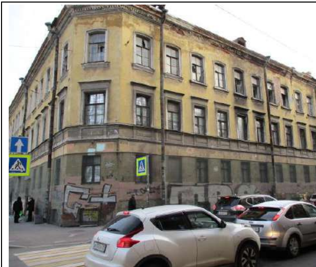
Фото 9. Вид здания, в котором расположен объект оценки