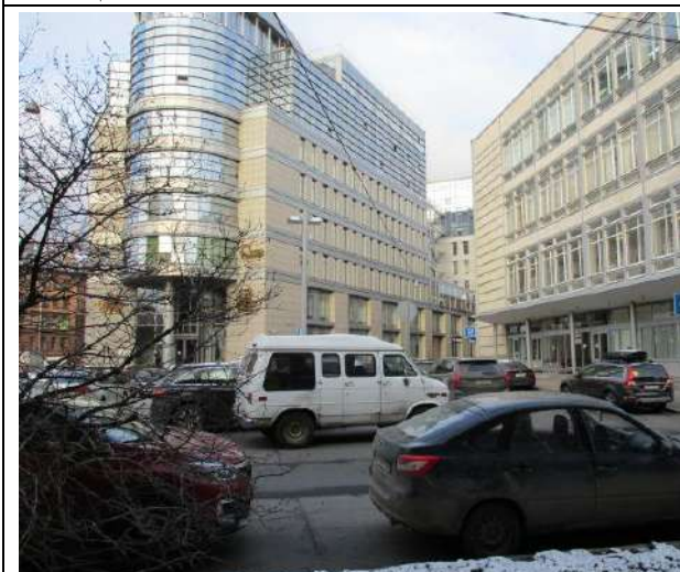
Фото 13. Ближайшее окружение объекта оценки