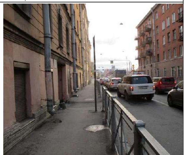
Фото 12. Ближайшее окружение объекта оценки