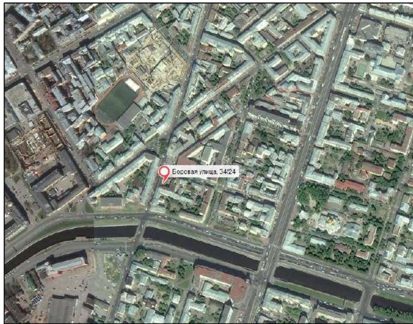
Рис. 3. Локальное местоположение Объекта оценки