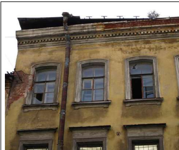
Фото 3. Вид здания, в котором расположен объект оценки