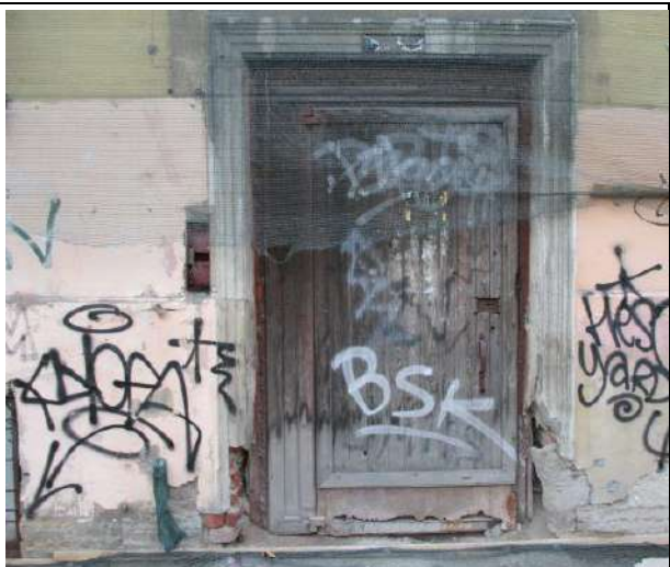
Фото 8. Вид здания, в котором расположен объект оценки