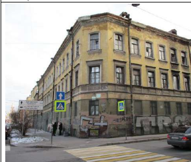
Фото 11. Вид здания, в котором расположен объект оценки