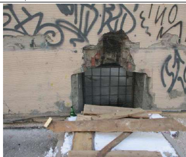
Фото 5. Вид здания, в котором расположен объект оценки