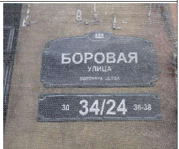
Фото 14. Табличка с номером дома, в котором расположен объект оценки