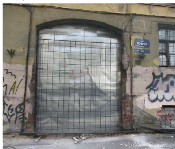
Фото 6. Вид здания, в котором расположен объект оценки