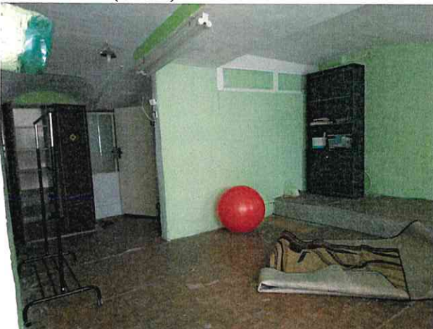
Фото № 11 (ч.п. 4)