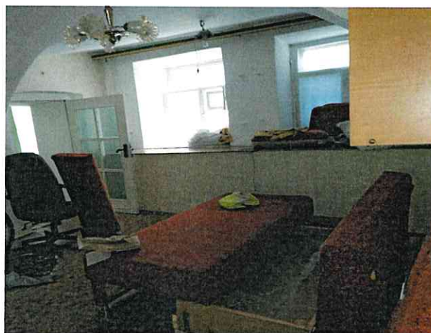
Фото № 10 (ч.п. 3)