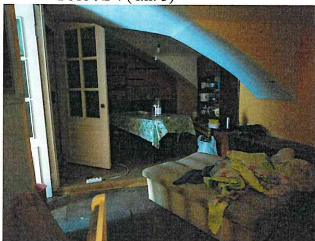
Фото № 4 (ч.п. 3)