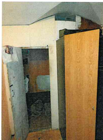
Фото № 8 (ч.п. 1)