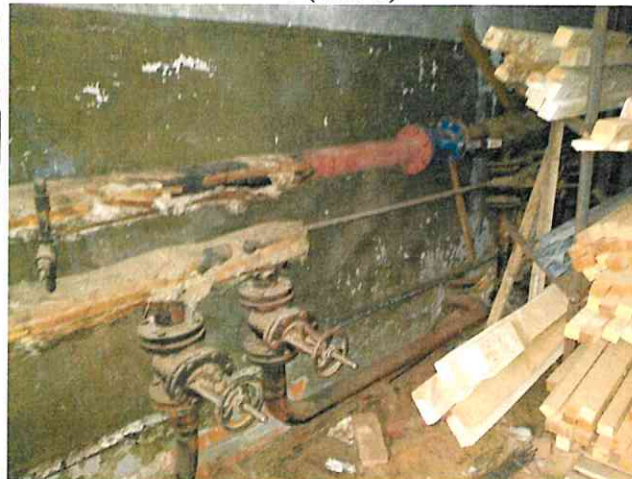
Фото № 17 (ч.п. 5)