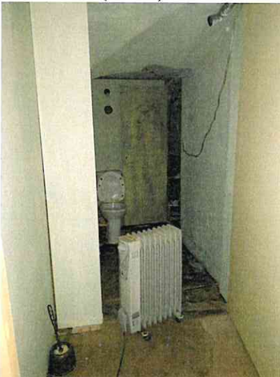
Фото № 5 (ч.п. 4)