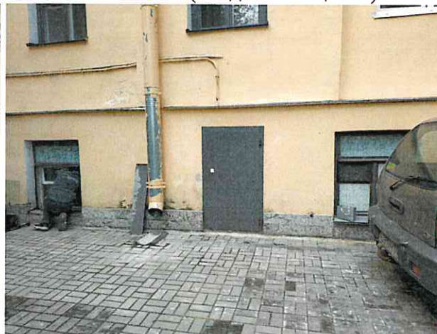
Фото № 2 (вход в помещение)