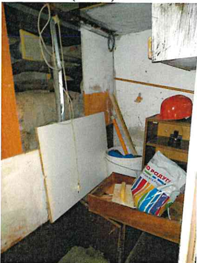
Фото № 9 (ч.п. 1)