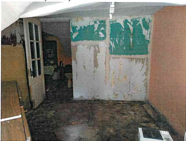
Фото № 3 (ч.п. 2)