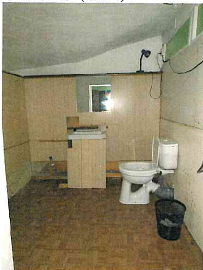
Фото № 14