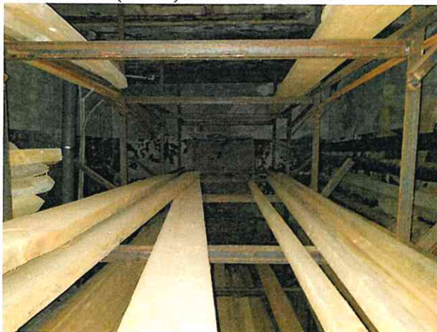
Фото № 18