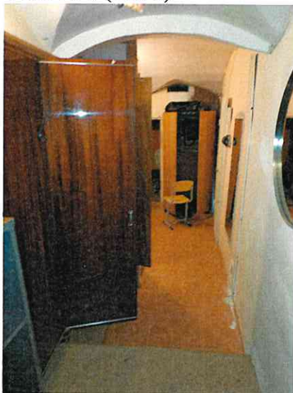
Фото № 7 (ч.п. 1)