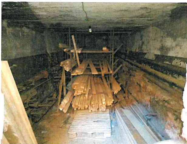
Фото № 16 (ч.п. 5)