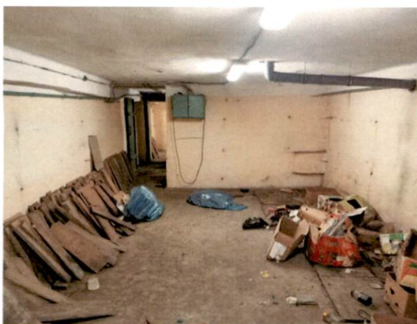
Фото № 15 (ч.п.7)