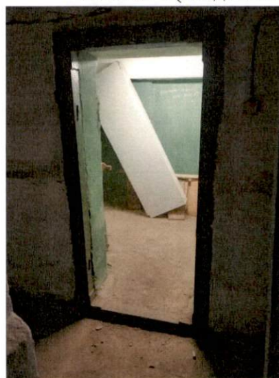
Фото № 4 (вход в помещение(ч.п.14))