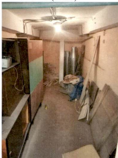
Фото № 11 (ч.п.5)