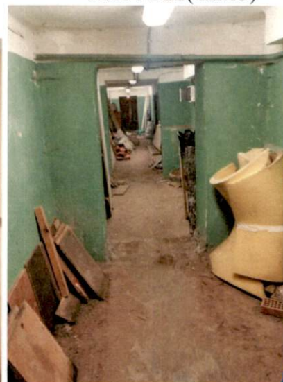
Фото № 23(ч.п.14)