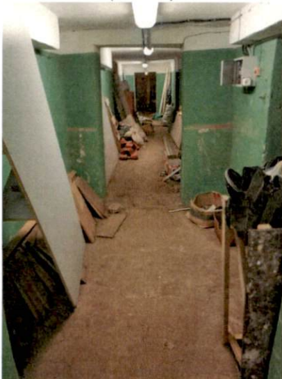
Фото № 24