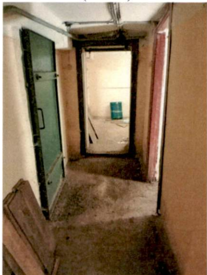
Фото № 20 (ч.п.12)