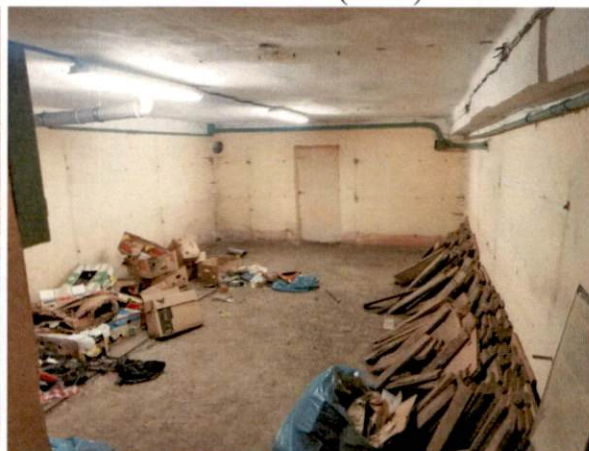
Фото № 14 (ч.п.7)