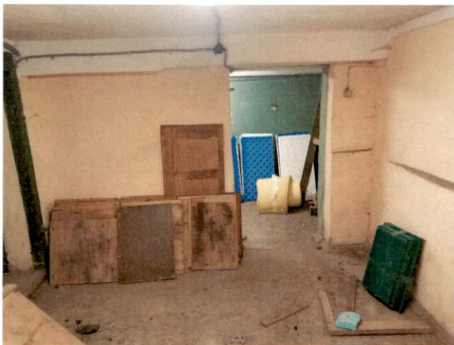
Фото № 22(ч.п.13)