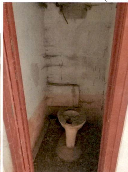
Фото № 16 (ч.п.8)