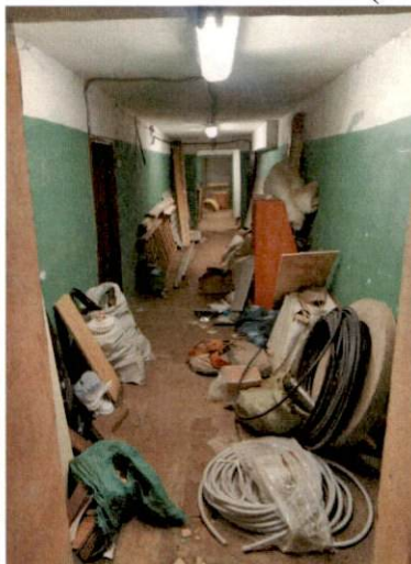
Фото № 10 (ч.п.4)