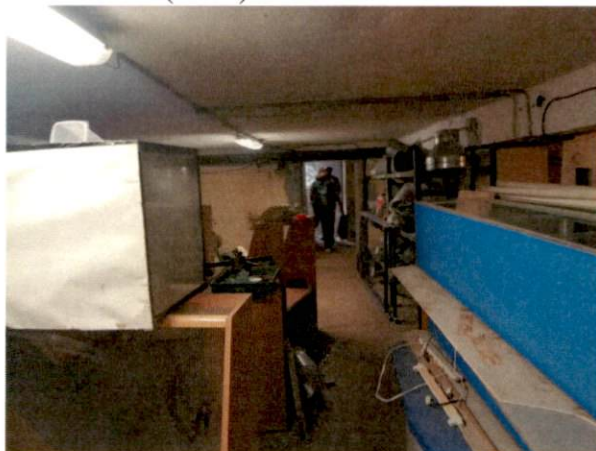
Фото № 13 (ч.п.6)