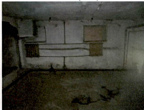
Фото № 8 (ч.п.2)