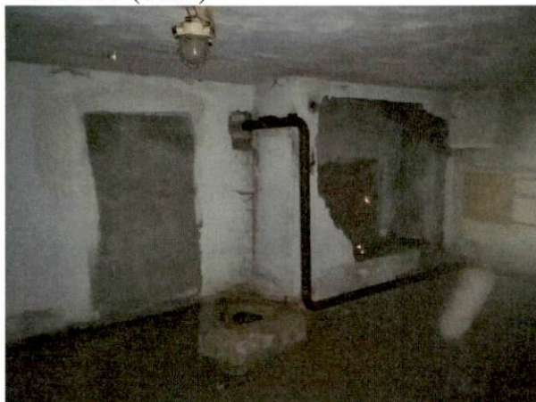
Фото № 7 (ч.п.2)