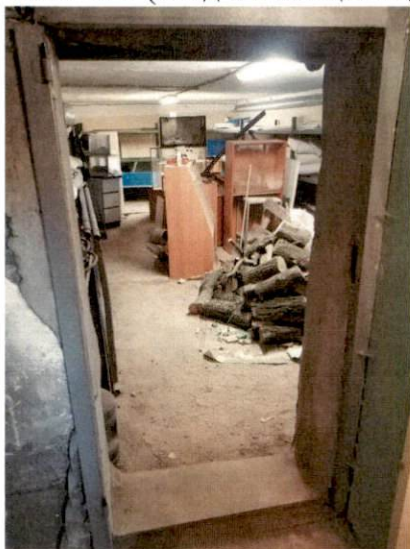
Фото № 3 (вход в помещение(ч.п.6))