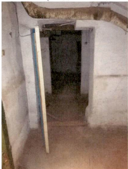
Фото № 5 (вход в помещение(ч.п.1))