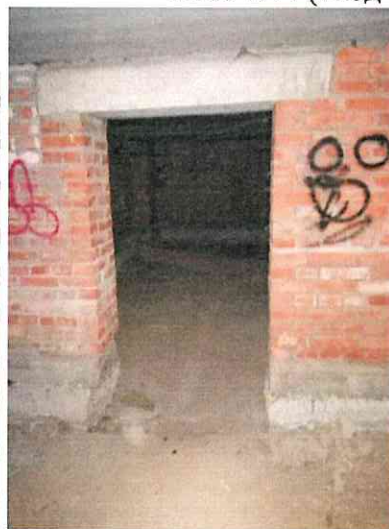
Фото № 4 (вход в пом. 7-Н ч.п2)