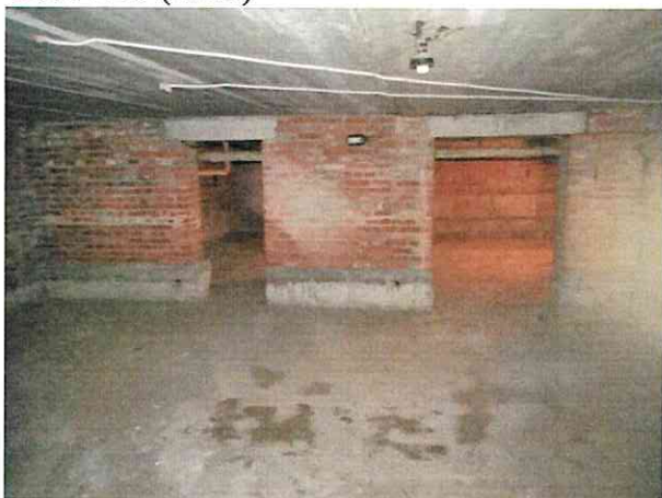
Фото № 9 (ч.п.1)