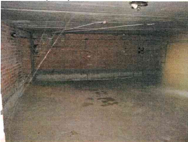
Фото № 5 (ч.п.1)