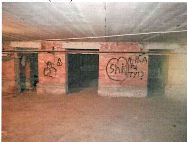
Фото № 13 (ч.п.2)

Акт осмотра объекта нежилого фонда от 05.12.2022, расположенного по адресу: г. Санкт-Петербург, Воскресенская наб., д. 6-8, лит. А, пом. 7-Н