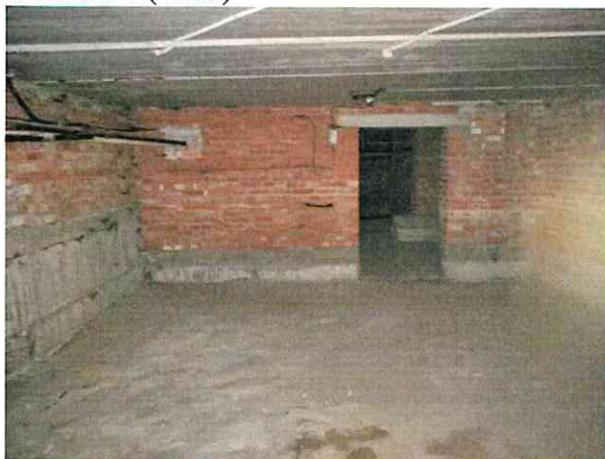
Фото № 7 (ч.п.1)