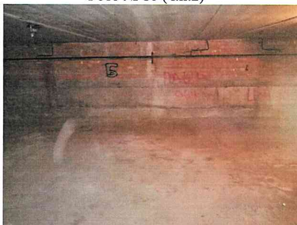
Фото № 10 (ч.п.2)