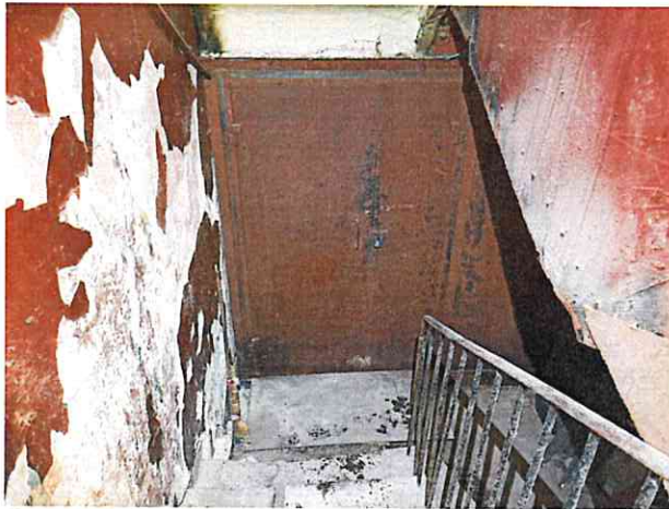
Фото № 7