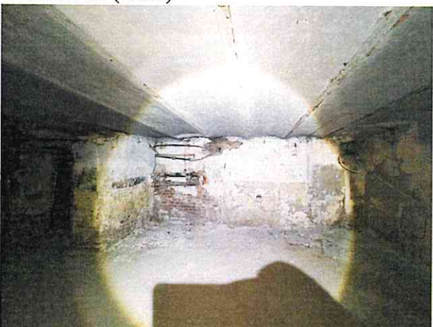
Фото № 11 (ч.п.1)