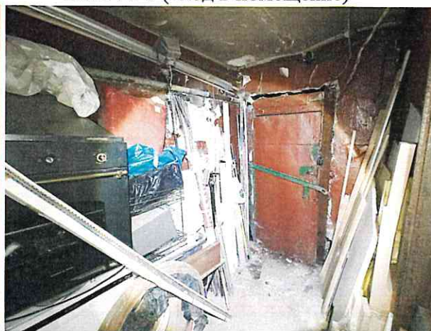
Фото № 8 (вход в помещение)