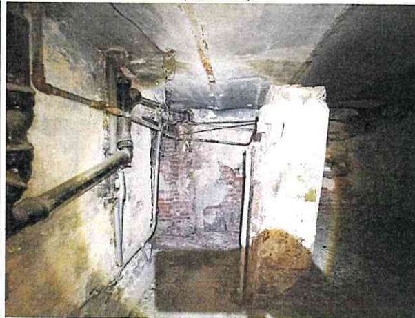
Фото № 14 (ч.п.1,2)