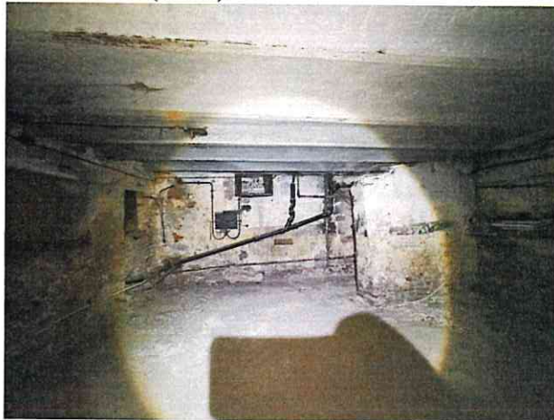
Фото № 13 (ч.п.1)