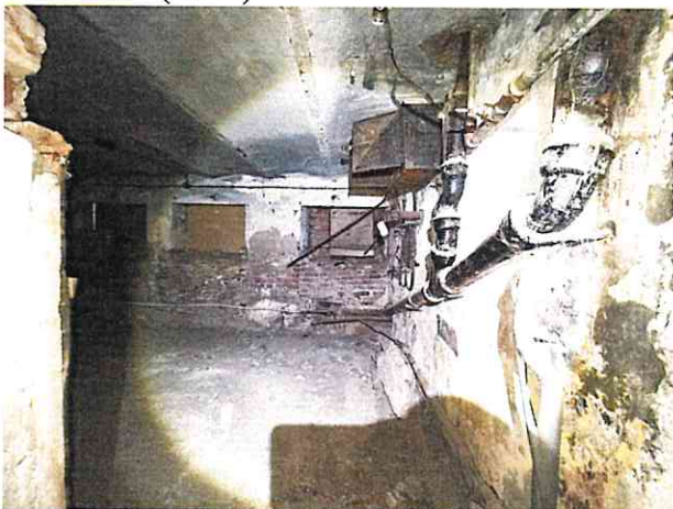
Фото № 9 (ч.п.1)