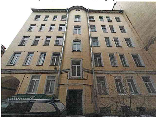
Фото № 3 (вход общий со двора)