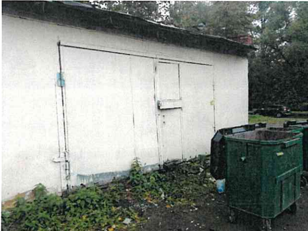
Фото № 5 (вход в помещение)