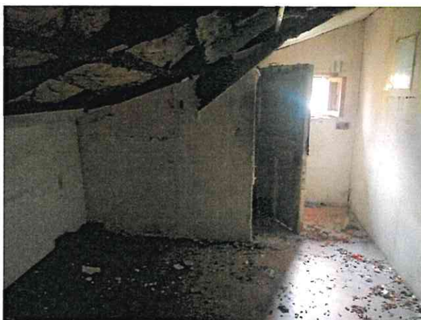
Фото № 16 (ч.п.1 пом. 3-Н)