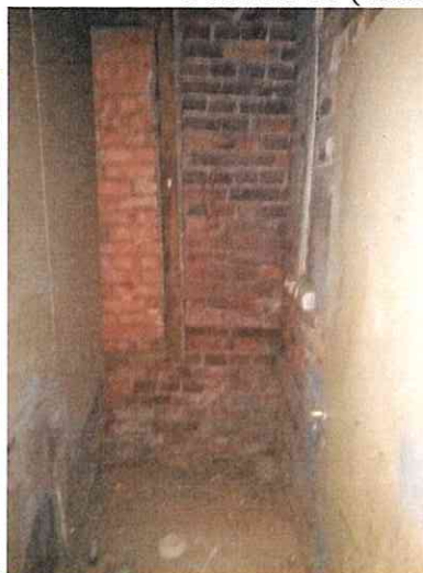
Фото № 17