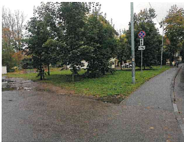
Фото № 20