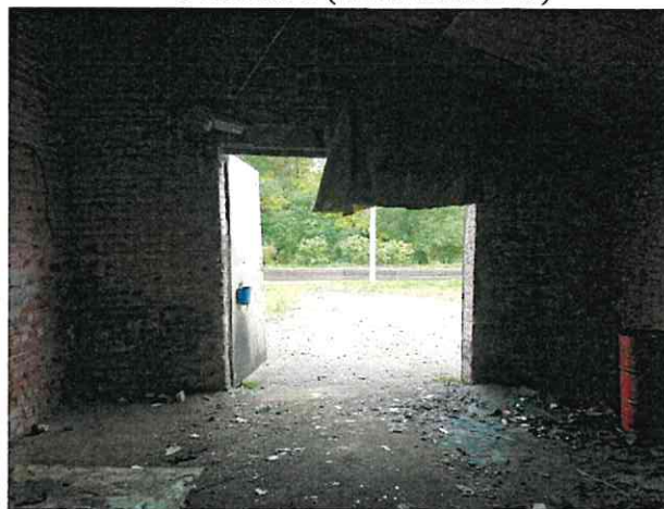
Фото № 8 (ч.п.1 пом. 2-Н)