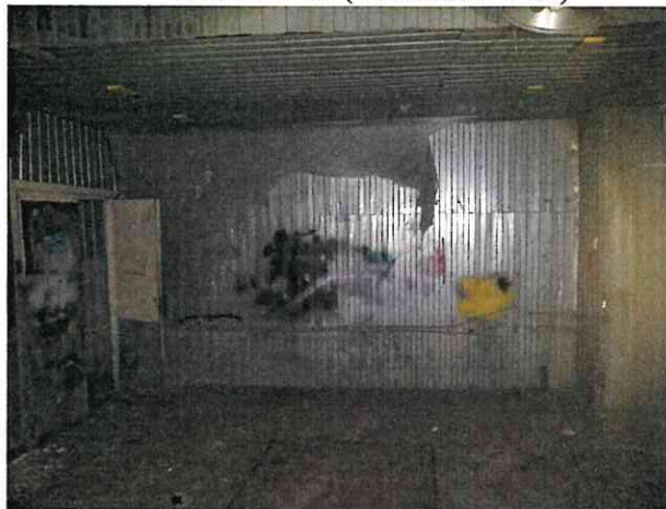
Фото № 10 (ч.п.1 пом. 3-Н)