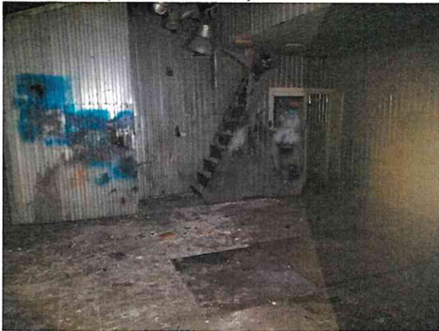
Фото № 9 (ч.п.1 пом. 3-Н)