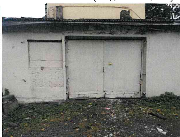
Фото № 4 (вход в помещение)