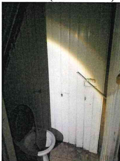
Фото № 14 (ч.п.1 пом. 3-Н)