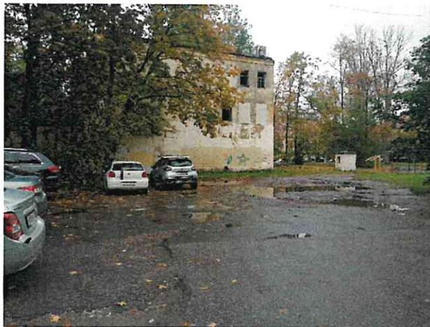
Фото № 19