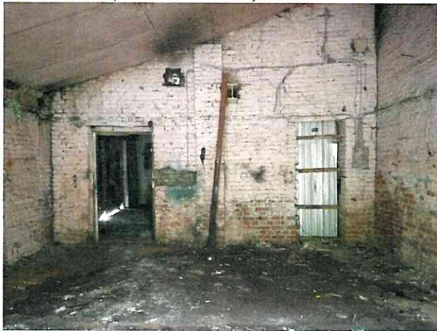
Фото № 7 (ч.п.1 пом. 2-Н)