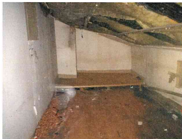
Фото № 15 (ч.п.1 пом. 3-Н)