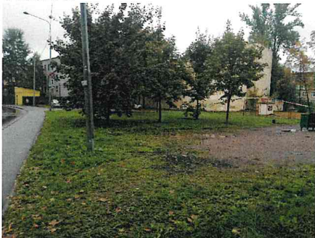
Фото № 18