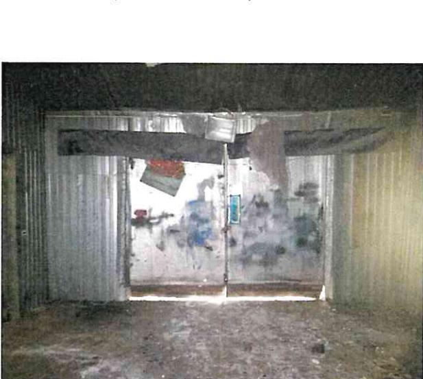
Фото № 11 (ч.п.1 пом. 3-Н)