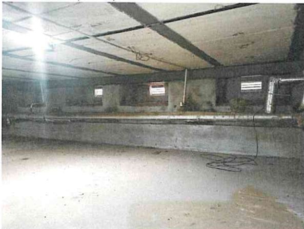
Фото № 7 (ч.п.1)