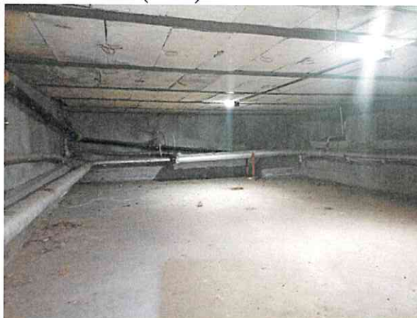
Фото № 8 (ч.п.1)