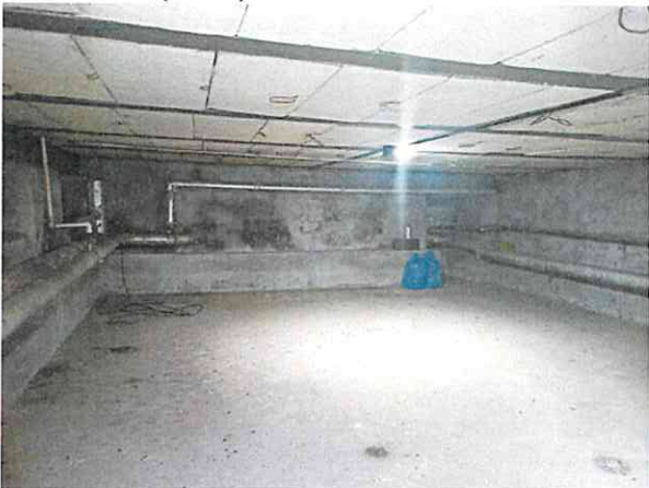
Фото № 9 (ч.п.1)