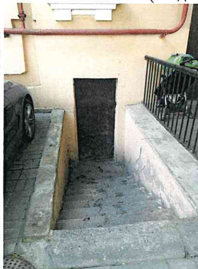
Фото № 2 (вход в пом. 13-Н)