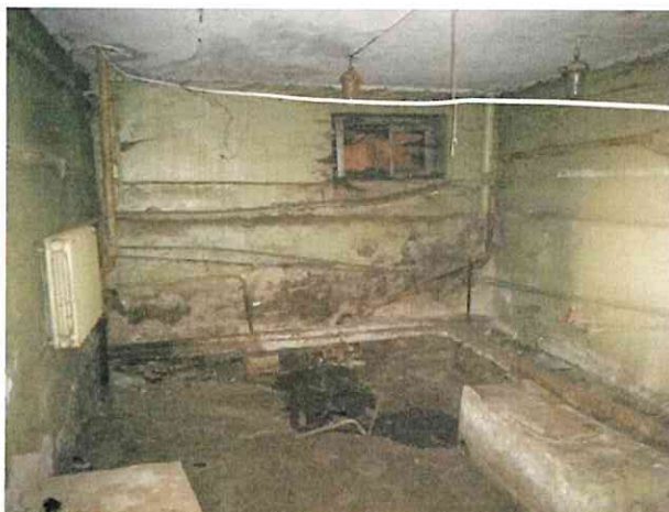
Фото № 4 (ч.п.1)