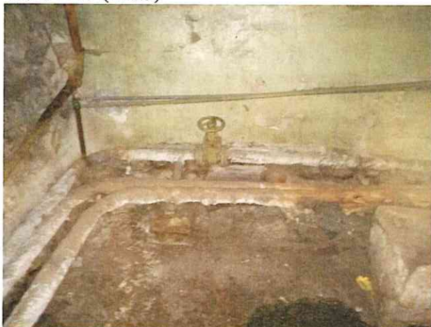
Фото № 5 (ч.п.1)