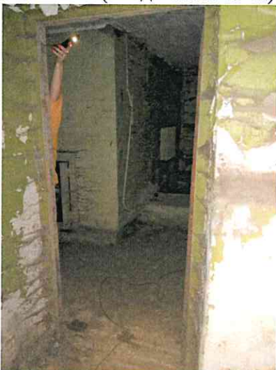
Фото № 3 (вход в пом. 19-Н)