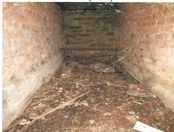
Фото № 8 (ч.п.2)