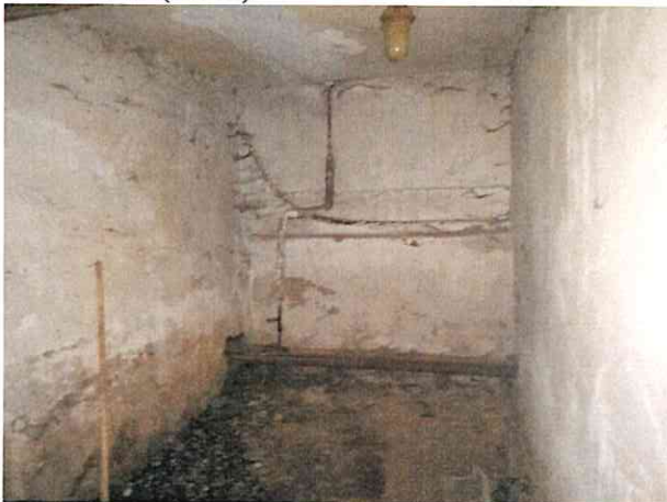
Фото № 9 (ч.п.3)