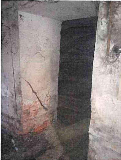
Фото № 3 (вход в помещение)