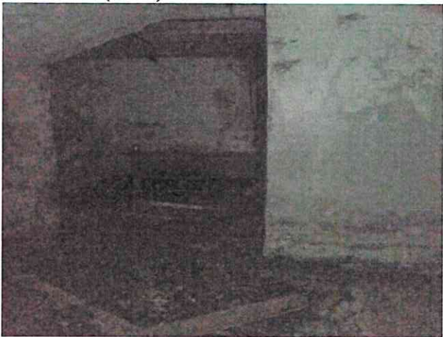
Фото № 9 (ч.п.2.)