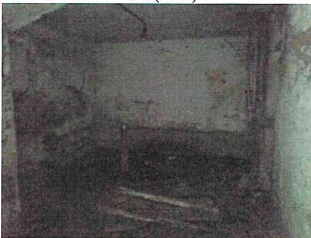
Фото № 10 (ч.п.2)