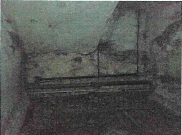
Фото № 11 (ч.п.2)