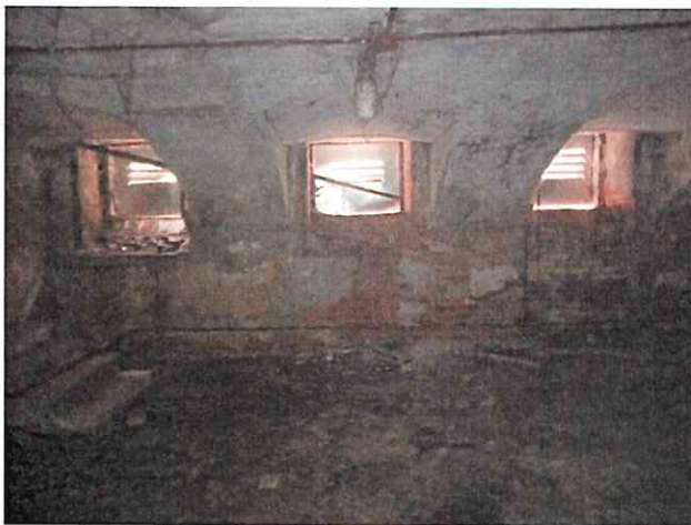
Фото № 7 (ч.п.5)