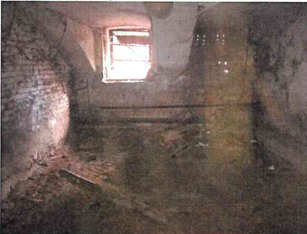
Фото № 5 (ч.п.3)