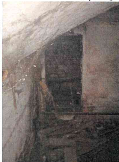
Фото № 8 (ч.п.5)