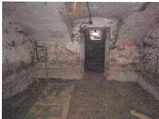
Фото № 4 (ч.п.3)