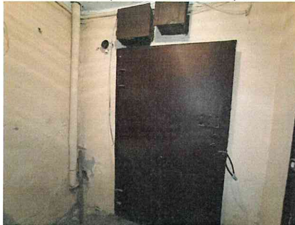
Фото № 4 (вход в помещение)