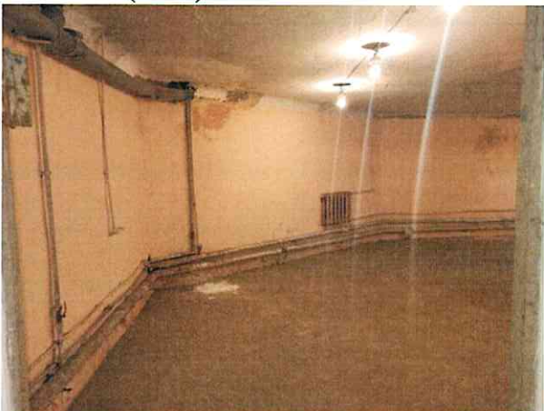
Фото № 5 (ч.п.1)