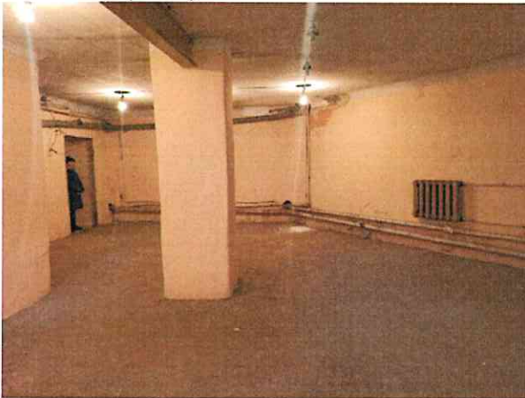
Фото № 9 (ч.п.1)