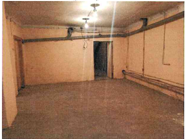
Фото № 8 (ч.п.1)