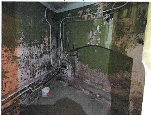
Фото № 10 (ч.п.2)