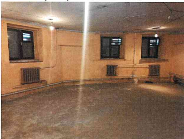
Фото № 7 (ч.п.1)