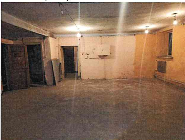
Фото № 9 (ч.п.1)