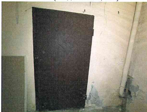
Фото № 4 (вход в помещение)