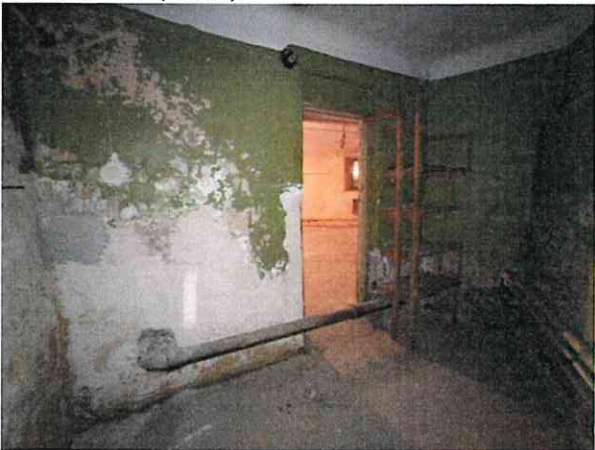
Фото № 11 (ч.п.2)