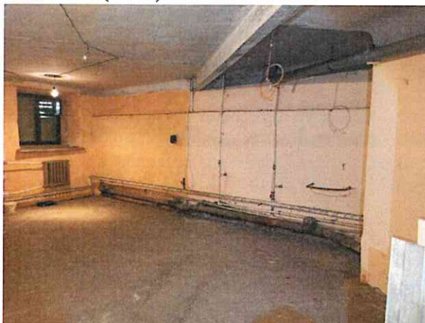
Фото № 5 (ч.п.1)