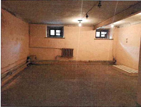
Фото № 7 (ч.п.1)