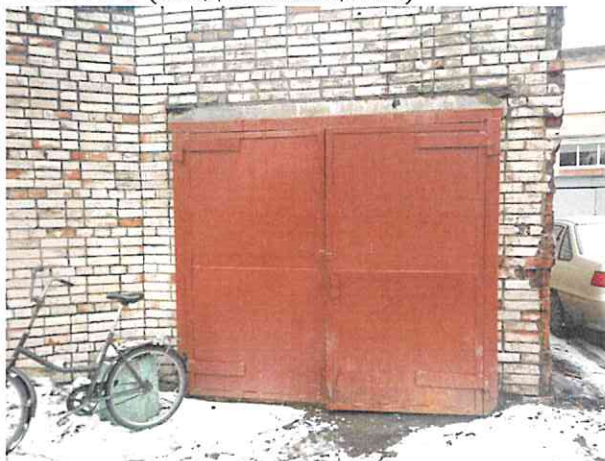
Фото № 3 (вход в помещение)