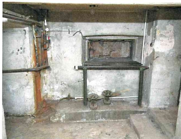
Фото № 10 (ч.п.2)