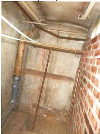
Фото № 9 (ч.п.2)

Акт осмотра объекта нежилого фонда от 28.04.2022, расположенного по адресу: г. Санкт-Петербург, ул. Союза Печатников, д. 26, лит. А, пом. 1002-Н Фото № 7 (ч.п.1) Фото № 8 (ч.п.1)