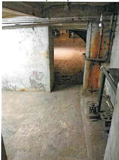
Фото № 5 (ч.п.1)