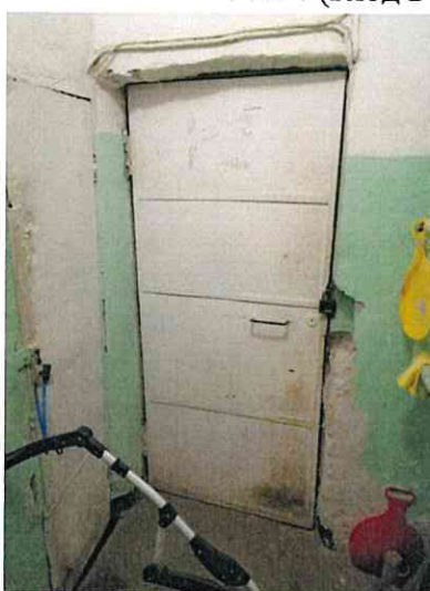
Фото № 4 (вход в помещение)