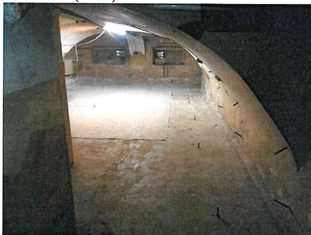
Фото № 11 (ч.п.2)