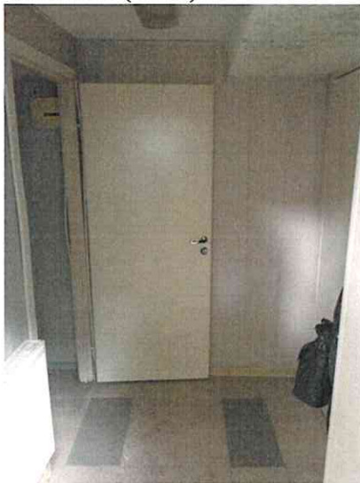
Фото № 9(ч.п.2)