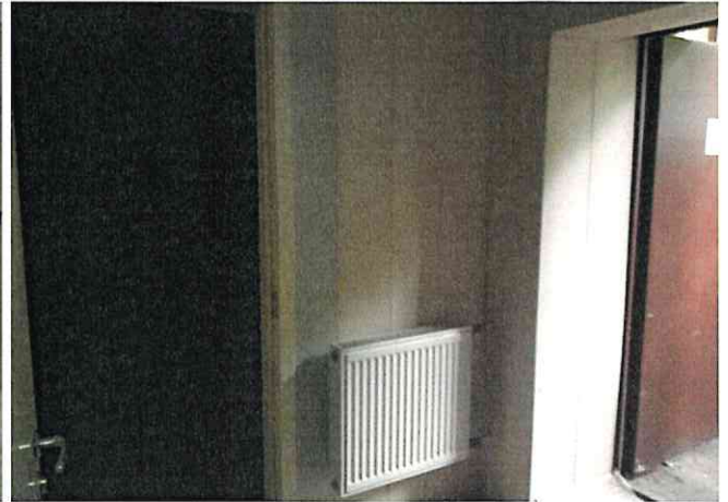
Фото № 8(ч.п.2)