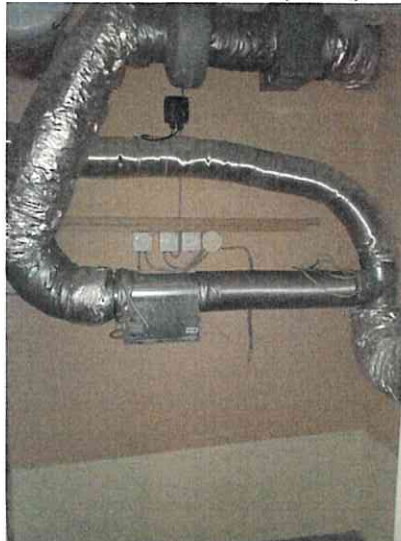
Фото № 14(ч.п.4)