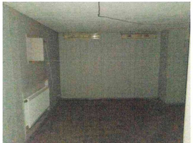
Фото № 10(ч.п.1,2)