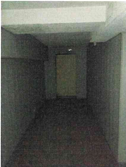
Фото № 13(ч.п.1)