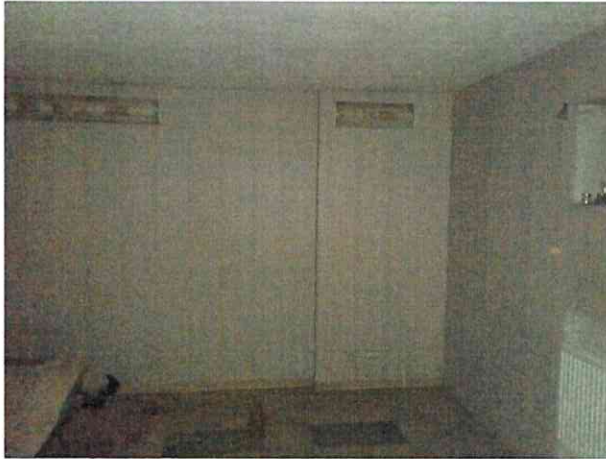
Фото № 7(ч.п.5)