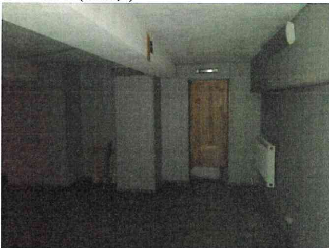
Фото № 15(ч.п.1,2)