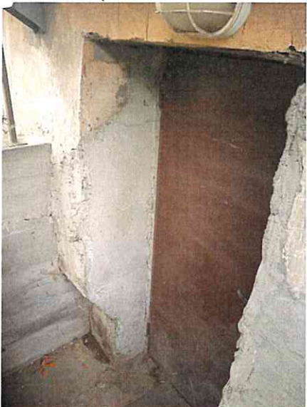
Фото № 5(отдельный вход в помещение)