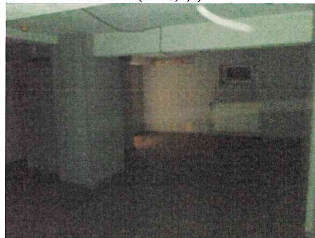
Фото № 16(ч.п.1,2,3)