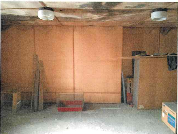
Фото № 5